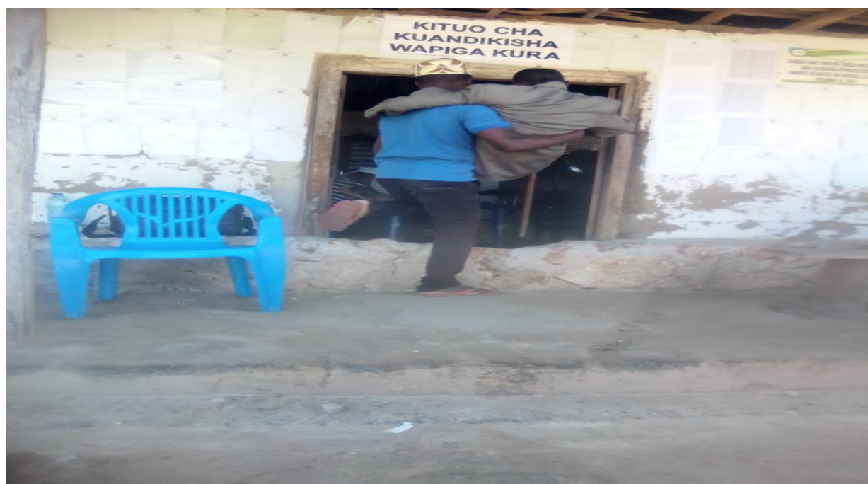
Baadhi ya vituo vya kuandikisha wapiga kura kama hiki cha Mikindani Mtwara havikuweza kufikiwa na watu wenye ulemavu.